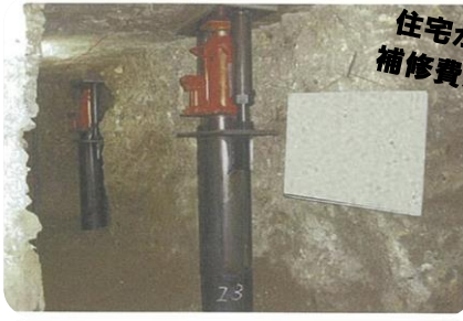
住宅が傾いていた！ 補修費用例：720万円