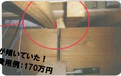
床が傾いていた！ 補修費用例：170万円