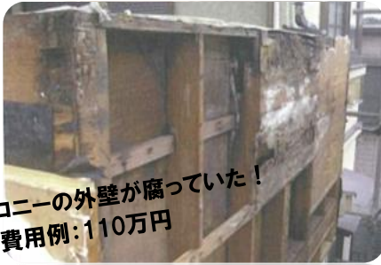
バルコニーの外壁が腐っていた！ 補修費用例：110万円