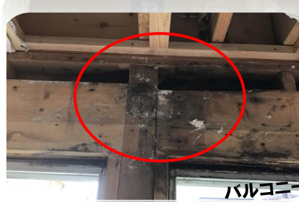
バルコニーのボルトより雨もれ 補修費用例：280万円